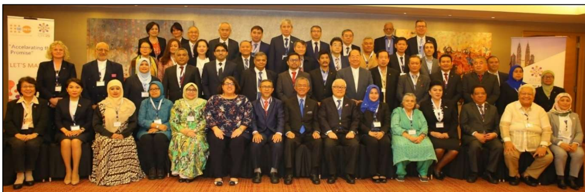
第31回人口と開発に関するアジア国会議員代表者会議に参加した 各国国会議員、国内委員会代表、国際機関代表、専門家