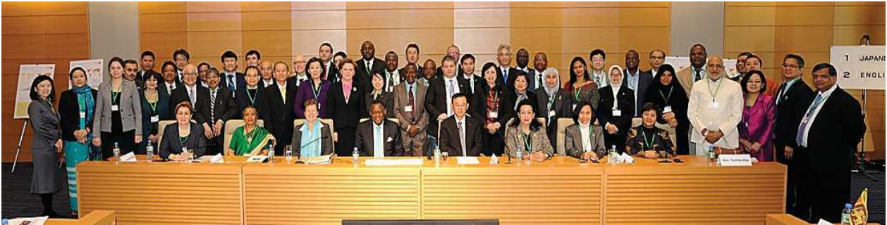
2013年11月18-19日に開催された国際国会議員会議 (IPCA) 中央は谷垣禎一 JFPF 会長とパバトウンデ・オショティメイン UNFPA 事務局長

今後の日本社会の設計図を考えるうえで貴重な機会となるものと考えております。ぜひ皆様のご参加をお待ち申し上げております。